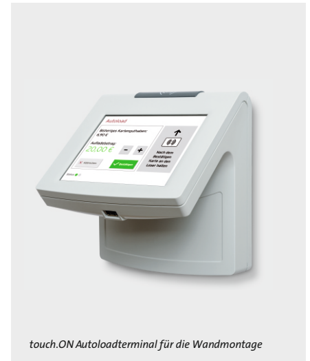
touch.ON Autoloadterminal für die Wandmontage